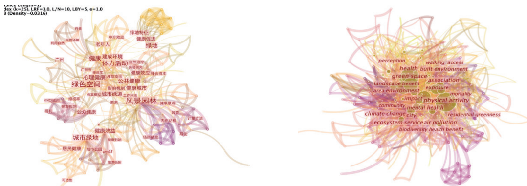
图 1 中(左)、英(右)文关键词共现图

利用已采集数据库的主题词及 CiteSpace 软件生成关键词共现图谱(图 1),发现国外研究出现体力活动(physical activity)、绿色空间(green space)、生态系统服务(ecosystem service)等频率较高和中心性较高的关键词,涉及绿色空间与居民健康的热点方向。根据时间线图(图 2)可发现,外文文献研究包括以下几个方面:(1)物理环境对健康的影响,如步行环境、可达性、肥胖症等。(2)绿色环境暴露对不同年龄段居民健康的影响。(3)生态环境对健康的影响,主要有生态服务系统、气候变化、空气污染等。